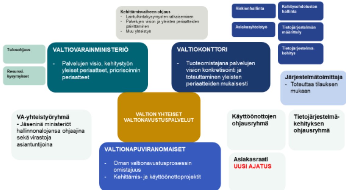
Kuvio 1 Valtionavustuspalvelujen hallinnan kokonaisuus

Kuviossa 1 esitetään kokonaiskuva valtionavustuspalvelujen kehittämisen hallintaan liittyvistä toimijoista, toimintamalleista ja toimielimistä.