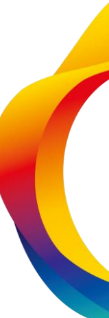
Kuvituskuvina: asiakasryhmittely ja käyttötapaus