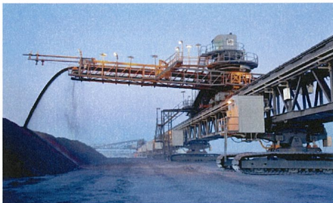
Entistä Talvivaaran kaivosta operaiva ja kehittävä Terrafame haki lokakuussa lupaa uraanin talteenotolle. Marraskuussa yhtiö kertoi suunnittelevansa akkukemikaalien tuotantoa.