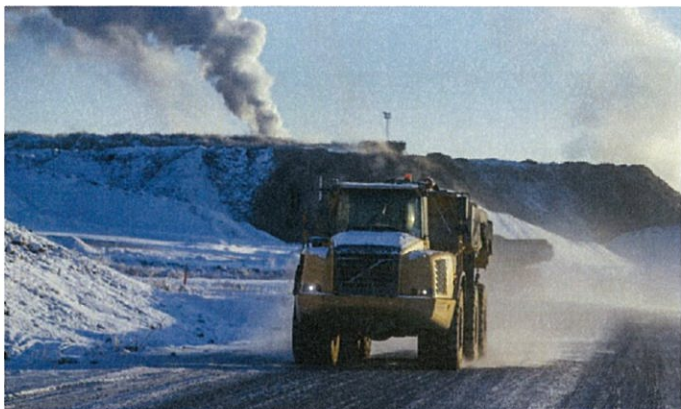
Agnico Eagle laajentaa Euroopan suurinta kultakaivosta Kittilässä 160 miljoonalla eurola. Suurikuusikkoon rakennetaan kilometrin syvyyteen ulottuva uusi kaivoskuilu ja lisää rikastamokapasiteettia.