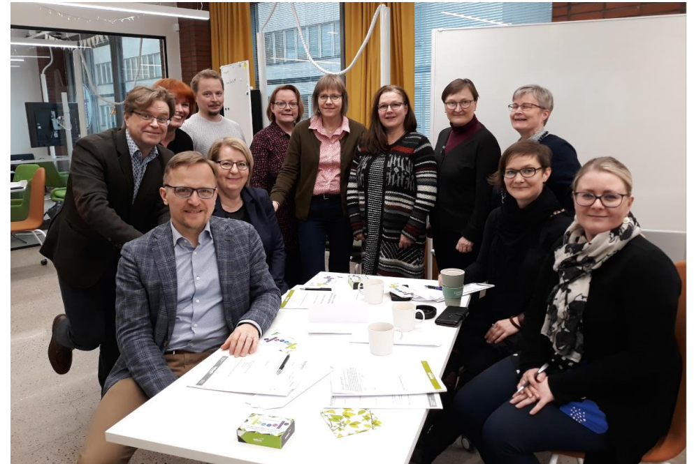
Kuva: Lotta Jalava